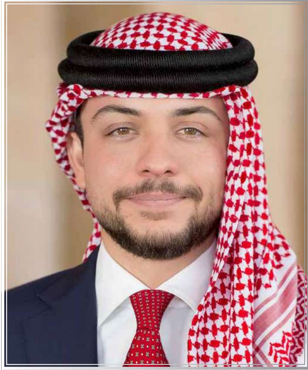
حضرة صاحب السمو الملكي الحسين ابن عبدالله الثاني ولي العهد